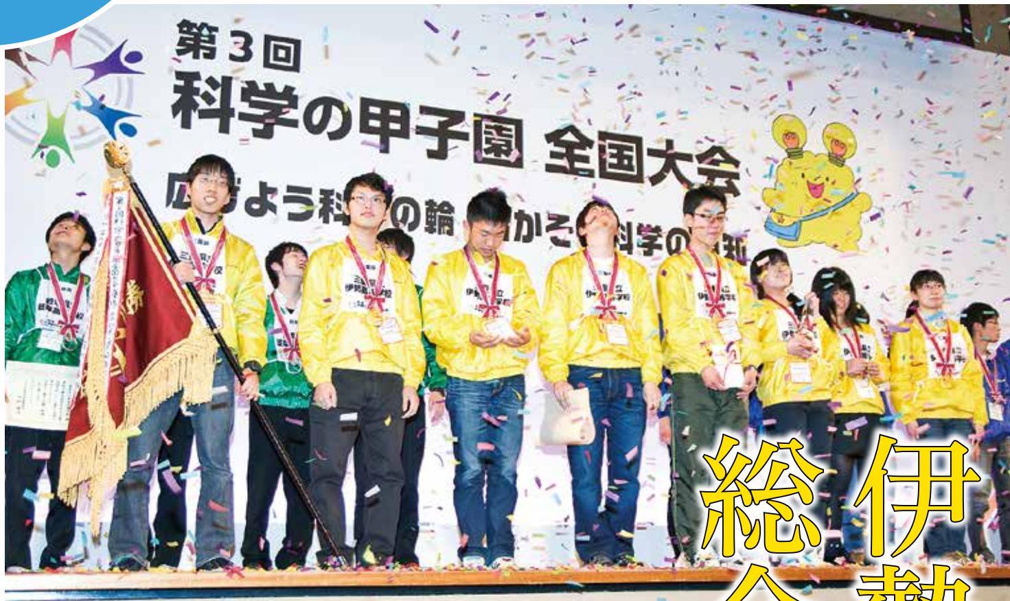
総合優勝した伊勢高校チーム