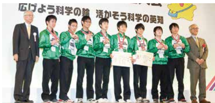
2位 岐阜・県立岐阜高校