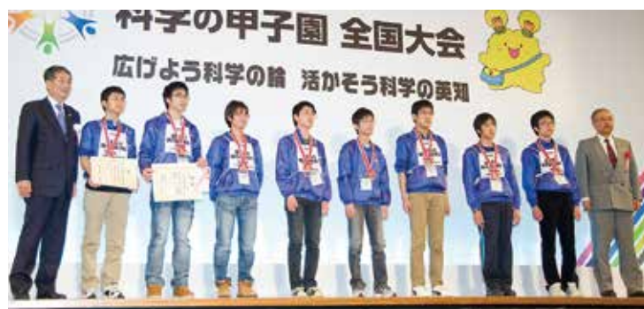
3位 滋賀・県立膳所高校