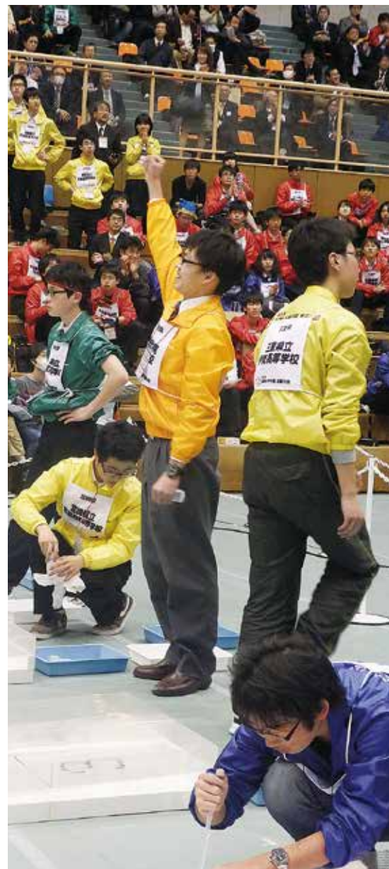
実技競技③はタイムを競う Mg ホバーレース